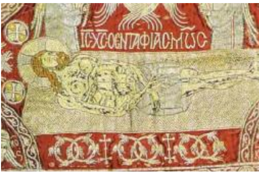
Monastero di Stavronikitva, dettaglio epitaphios

Sul monte Athos si conservano due epitàfi del 1346 e del 1397 su cui sono ricamati quattro tropari degli enkòmia , chiamati anche thrènoi o epitàfioi thrènoi , cioè lamentazioni o lamenti funebri. Purtroppo si ignorano gli autori, ma sono certamente molto antichi, probabilmente ispirati dai testi di Gregorio Nazianzeno (IV secolo) o di Romano il Melode (V-VI secolo).