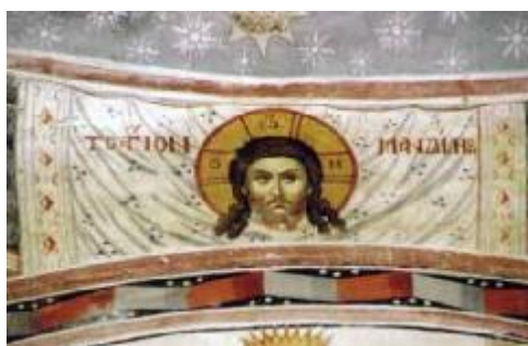
Mandyllion monastero di Docheiariou

I Padri della chiesa orientali e gli scrittori bizantini, poi, si sono certamente ispirati alla millenaria tradizione e alla vita liturgica delle chiese d'oriente, di cui fanno parte integrante sia le icone che le lipsana (reliquie) . Non ci si deve pertanto stupire se esiste una profonda relazione tra queste e il simbolismo di alcuni strumenti o momenti della liturgia nel rito bizantino. Cerimoniale che è considerato, soprattutto